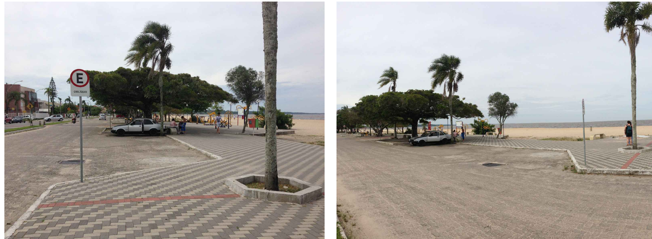
PONTO 4 - Próximo à esquina da rua Piratini