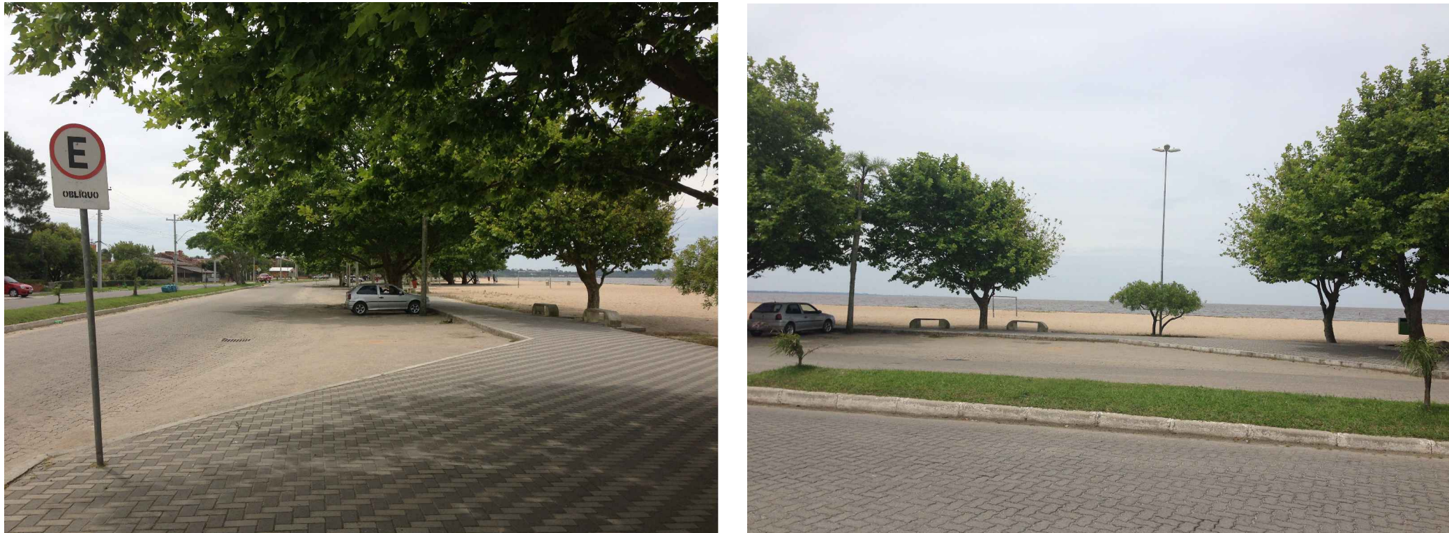
PONTO 2 - Próximo à esquina da rua Senador Joaquim Augusto Assumpção