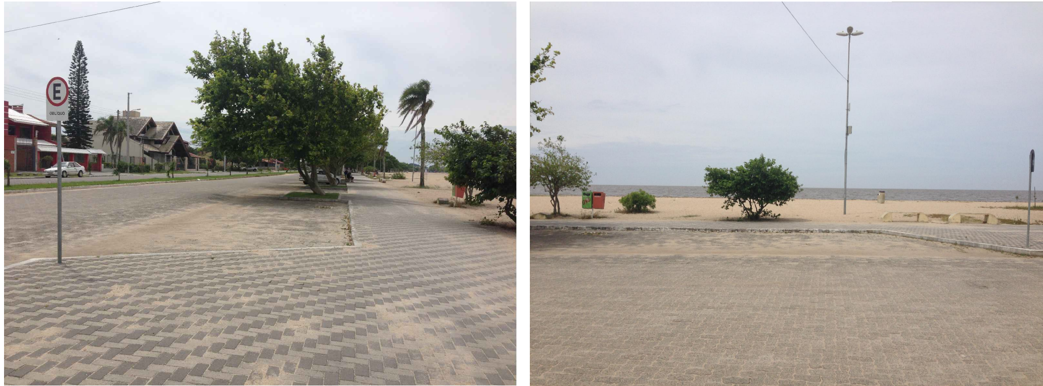
PONTO 1 - Próximo à esquina da rua Arthur Augusto Assumpção