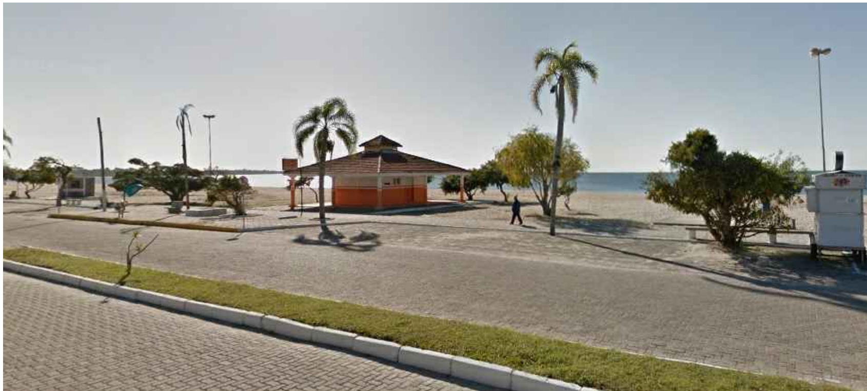
PONTO 3 - Próximo à esquina da rua Bagé